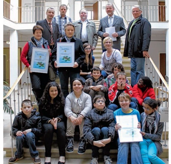
Die Linnicher Gewinner freuen sich über das Preisgeld!

Projekt: Erstellung eines Konzeptes rund um das The-