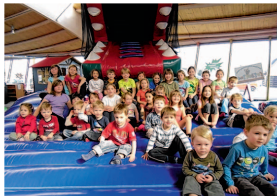
Die Kinder der Turnabteilung des Pol.-TuS Linnich hatten viel Spaß auf dem Indoorspielplatz „Fridolino“

Die gebuchte Zeit bis 13 Uhr verging für die Kinder wie im Flug. Ob Riesenkletterturm, Rollenrutsche, Mini-Autoscooter, Vulkan, Krokodil, Trampolin oder die verschiedenen Hüpfburgen und vieles mehr – alles