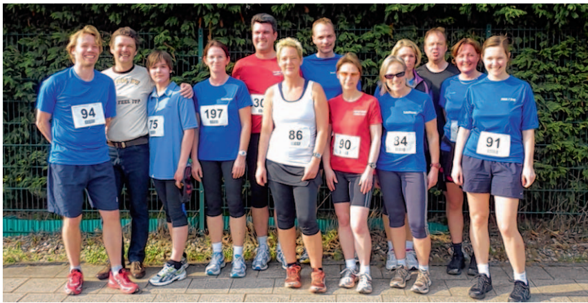
Die Laufkursgruppe vom Polizei-TuS Linnich und der SLC Ameln am Start beim Volkslauf in Titz.