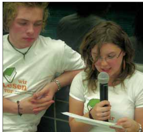
... oder in der Schwimmhalle in Linnich ...