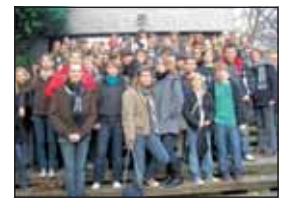
Gruppenfoto der Schüler aus Linnich und der Partnerschule aus Lesquin.

sichtigt, ebenso der Weihnachtsmarkt. Er öffnete genau an diesem Vormittag seine Stände, sehr zur Freude der französischen Gäste, da solche Weihnachtsmärkte