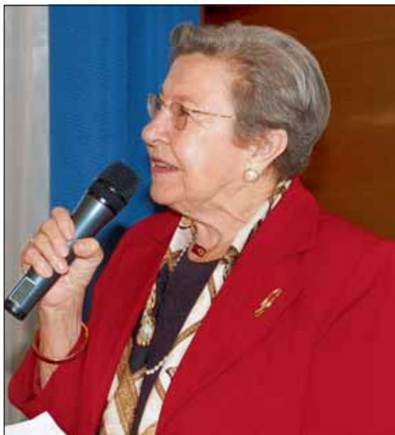
„Aktiv im Alter“: Reichlich Stoff zum Nachdenken lieferte unter anderem die frühere Bundesfamilienministerin Prof. Dr. Dr. h.c. Ursula Lehr.

Fachforums „Aktiv im Alter“ begrüßt hatte, forderte Ursula Lehr – Jahrgang 1930 – zu einer „Kalenderreform unseres Lebens“ auf: „Wir müssen das Alter später beginnen lassen“, warb sie dafür, das heute übliche „Defizit-Modell des Alters“ in Frage zu stellen. Die „neuen Alten“ sind heute mit 75 Jahren eben nicht durchweg pflegebedürftig, sondern aktiv und fit – mit gewissen Einschränkungen natürlich. Voraussetzung: Sie setzen sich nicht zur Ruhe. Denn „wer rastet, rostet“ gilt nach wie vor. In ihrem mit vielen Fakten und Prognosen angereicherten Impulsreferat zeichnete sie ein Bild unserer Zukunft, die längst begonnen hat. „Wir werden älter, weniger, bunter und dementer“ lautete ihre gesellschaftliche Diagnose in Kurzform. Das hat Konsequenzen. Da das traditionelle familiäre Netz immer weitere Maschen aufweist, müssen neue tragfähige Fäden gesponnen werden, um alle Menschen aufzufangen: nachbarschaftliche, freundschaftliche, professio-