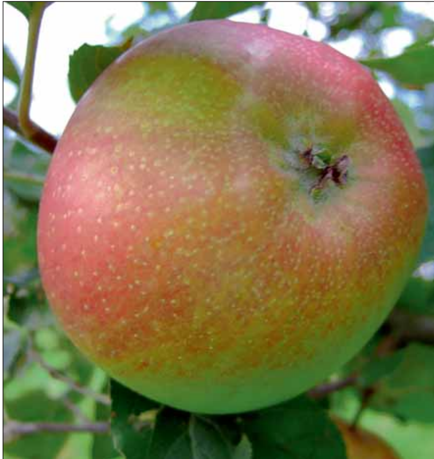
Ein Vortrag über den heimischen Apfel und seine Pflege für alle Obstbaumbesitzer.