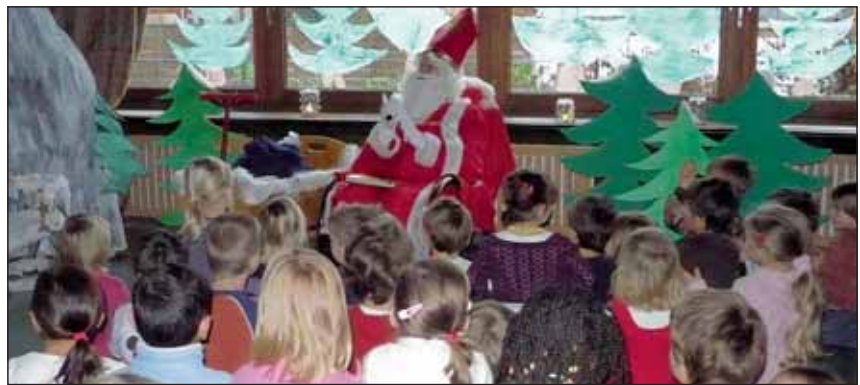
Gespannt lauschten die Kinder dem Nikolaus.