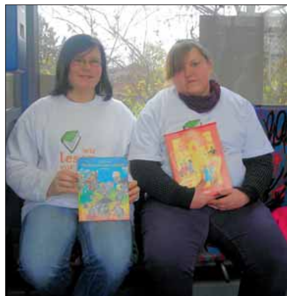
... oder wie hier in der Rurtalbahn. Am Vorlesestag wurden die ungewöhnlichsten Orte zur Lesestube.