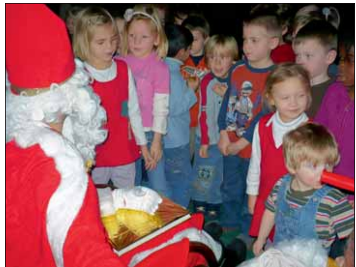
Es war ein sehr aufregender und sehr schöner Nikolaustag für die Kinder und wahrscheinlich auch für den Nikolaus.