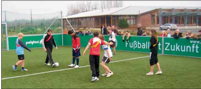
Zum Abschluss der Veranstaltung lieferten sich zwei Mannschaften der Hauptschule Linnich eine spannende Fußballpartie auf dem neuen Platz.

Sein besonderer Gruß galt jedoch den Kindern und Jugendlichen, für die die Stadt Linnich nicht unerhebliche Finanzmittel im Zusammenhang mit dem Bau