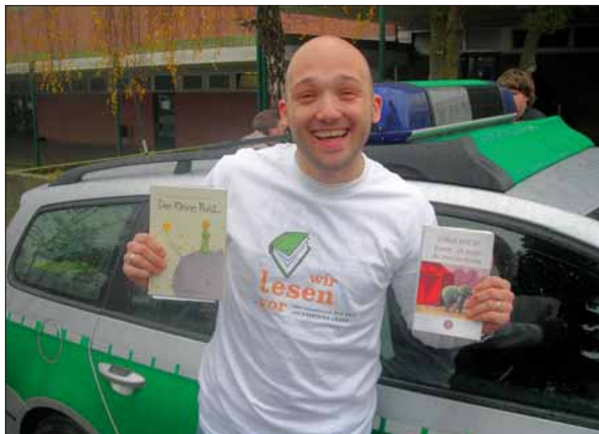
Ob auf dem Schulhof der GHS Linnich...