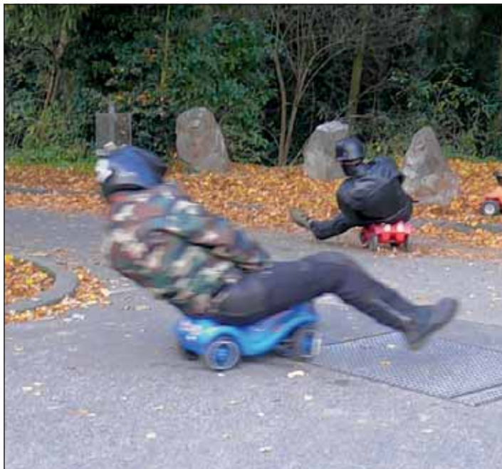
Mit dem BobbyCar den Berg hinunter rasen bei der 1. Rurdorf-Special-Mittsommer-BobbyCar-Challenge.