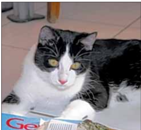
Welcher Tierliebhaber möchte diesem verschmutzten Vierbeiner eine neue Bleibe geben?

mit allem Möglichen aus. Wir wohnen im Moment noch in einer „Pflegestelle“, wie die Menschen das nennen. Es ist ja schon toll hier, aber wir möchten doch endlich bei unserer richtigen Familie ins Zuhause einziehen. Wir brauchen Menschen, die mit uns spielen und auch viel Zeit zum Schmusen haben. Ach ja, es gibt da auch noch Pünktchen und Anton, unsere beiden Geschwister, genauso hübsch und lieb wie wir, auch die beiden suchen ein neues Zuhause zum Spielen, Toben und Schmusen! Wir werden entwurmt, grundgeimpft, kastriert, gekennzeichnet, bei TASSO gemeldet und gegen Vertrag vermittelt. Infos unter: 02463 907258 02461 342209 015776810046 irene.launer-hill@gmx.de www.s-a-m-t.de