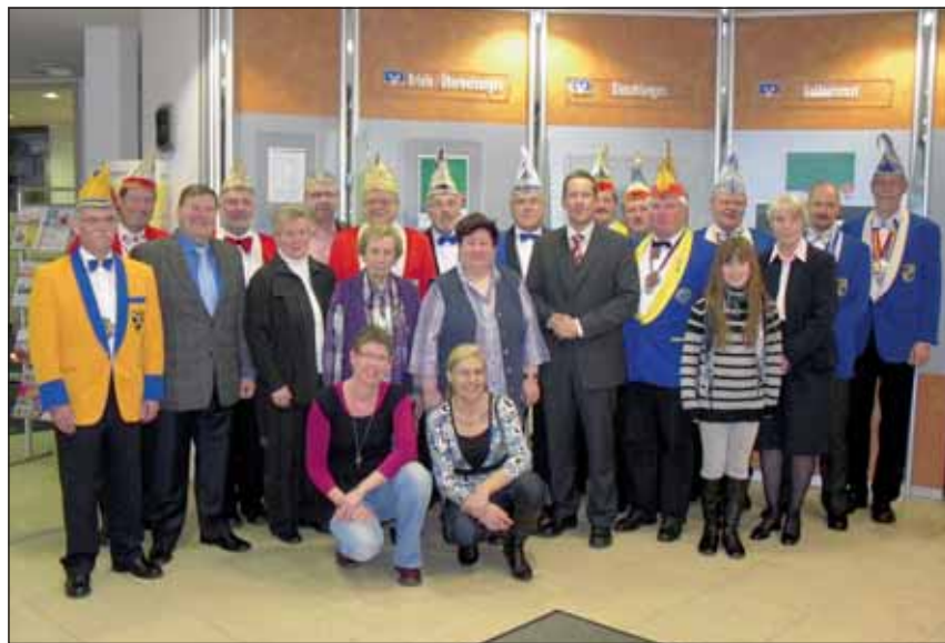
Bei der Spendenübergabe in der Hauptstelle der Bank.