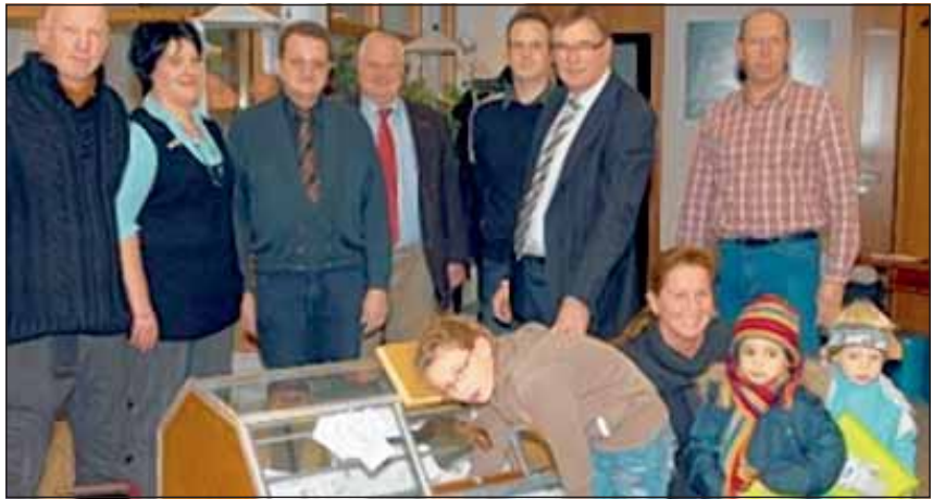
Die Kaufmannschaft der Werbegemeinschaft Linnich ermittelte die Gewinner der Weihnachtsverlosung und des Krippenweg-Suchspiels.