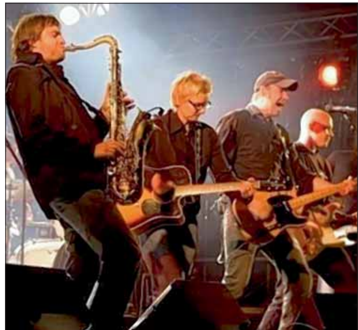
Musik steht selbstverständlich auch beim 3. Rurdorf-Special im Mittelpunkt.