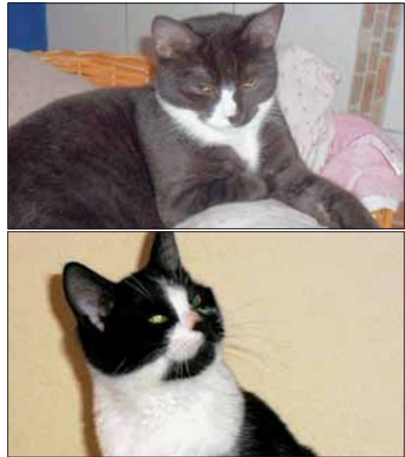
Milo und Caruso würden gerne in ein neues Zuhause ziehen.

bung e.V. unter der Rufnummer 02461/53076 oder per Mail über die Internetseite www.tierhilfe-juelich.de . Dort können sie sich auch über unsere anderen Schützlinge informieren. Zur Zeit betreuen wir ca. 85 Tiere, davon, 8 Katzen, 25 Kaninchen, 26 Meerschweinchen, 8 Ratten, 2 Mäuse, 2 Zwerghamster, 2 Wellensittiche, 1 Nymphensittich, 1 Kanarienvogel, sowie 7 Ziertauben. Gerne können sie uns und unsere Arbeit durch Spenden unterstützen. Wir freuen uns über jede Geld- und auch Sachspende. Auch können sie eine Patenschaft für einen unserer Pfleglinge übernehmen. Weitere Informationen dazu finden sie auf unserer Internetseite.