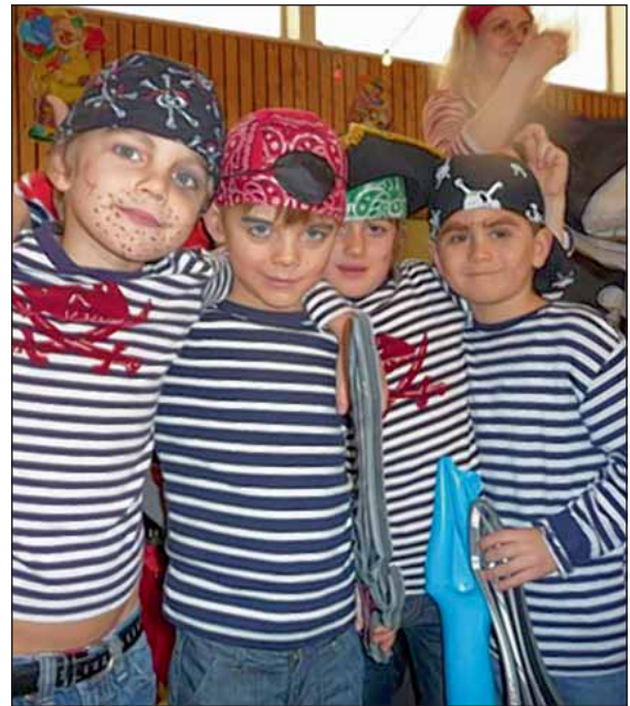
Auch die kleinen Festpiraten rockten das Narrenschiff und begeisterten das Publikum.