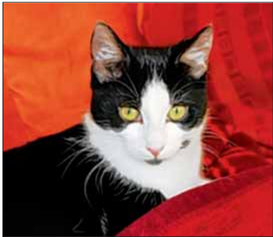
Dieser Stubentiger ist auf der Suche nach einem neuen, liebevollen Zuhause.