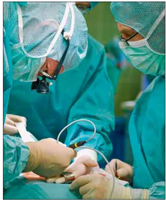
In der Chirurgischen Abteilung des St. Elisabeth-Krankenhauses in Jülich ist jetzt eine verbesserte Methode zur Identifikation des Stimmbandnerven an der Schilddrüse möglich.

führten Schilddrüsen-Operationen, bei denen aufgrund einer nicht zu starken Vergrößerung der Schilddrüse sehr kleine Schnitte, ca. 2 cm, möglich sind, ist es mit dem neuen Neuromonitoring-Gerät nicht mehr nötig, Elektroden in den Stimmbandmuskel einzubringen, wie es bei den Vorgängerge-räten erforderlich war. So wird die Möglichkeit der vorübergehenden Funktionsstörungen des Stimmbandnerven, die aufgrund von Blutergüssen im Stimmbandmuskel auftraten, nahezu ausgeschlossen. Die OP kann dann in Schlüsselloch-technik durchgeführt werden. Das kosmetische Ergebnis im Hinblick auf sichtbare Narben ist hierbei deutlich besser.