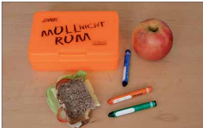
Aus der knallorangen Butterbrotdose schmeckt das Pausenbrot nochmal so gut.