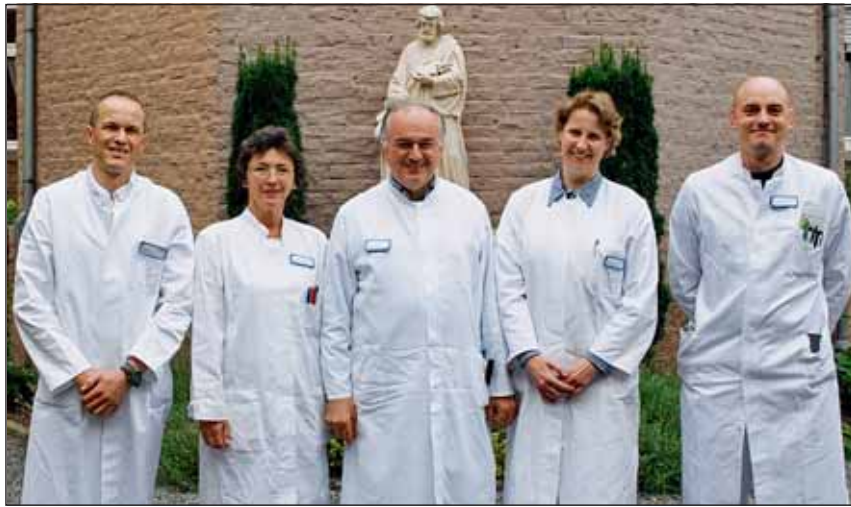
Vier neue Oberärzte sorgen im St. Josef-Krankenhaus Linnich für zusätzliche medizinische Kompetenz.