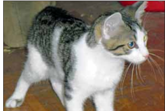
Mikesch sucht ein neues, liebevolles Zuhause.