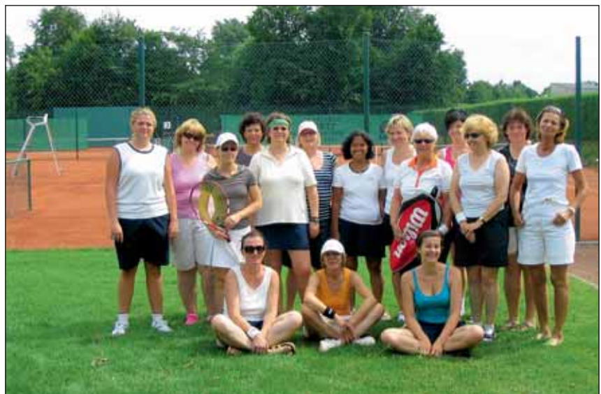
Die Damen des TC Schwarz Gold Linnich trafen sich zum Späßturnier.

Alle Teilnehmerinnen freuen sich schon auf das nächste Späßturnier im Sommer 2011!