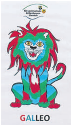
GALLEO-Maskottchen der GALier.