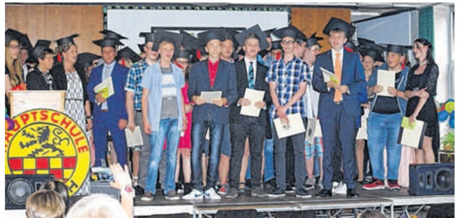
„Auf uns“ – Die Entlassjahrgangsstufe der GHS Linnich.

auf die pubertären Entwicklungen der aktuellen Stufe 10 hin. Frau Büttgen, Klassenlehrerin der 10B, verwies dabei auf den Ist-Zustand, der sich dadurch auszeichnet, dass modische Entwicklungen und Essgewohnheiten auch vor dem schulischen Alltag keinen Halt machten. Zu einem Highlight kam es im Anschluss an diese drei äußerst kurzweiligen Reden der Pädagogen, als eine gemischte Schülergruppe aus der Stufe 10 einen etwas anderen Redebeitrag leistete. Anstatt der obligatorischen und zu erwartenden Dankesrede von Schülern wurde eine sehr durchdachte und gleichzeitig humorvolle Aufführung dargeboten. Hierbei beschrieben Schülerinnen und Schüler ihre persönlich verschiedenen ersten Schultage an der GHS Linnich, die teilweise von Sorgen und Ängsten aber auch lustigen Vorkommnissen geprägt