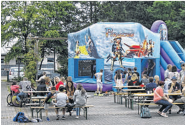
Die Hüpfburg war ein Höhepunkt von GALy's Spiele-Olympiade.