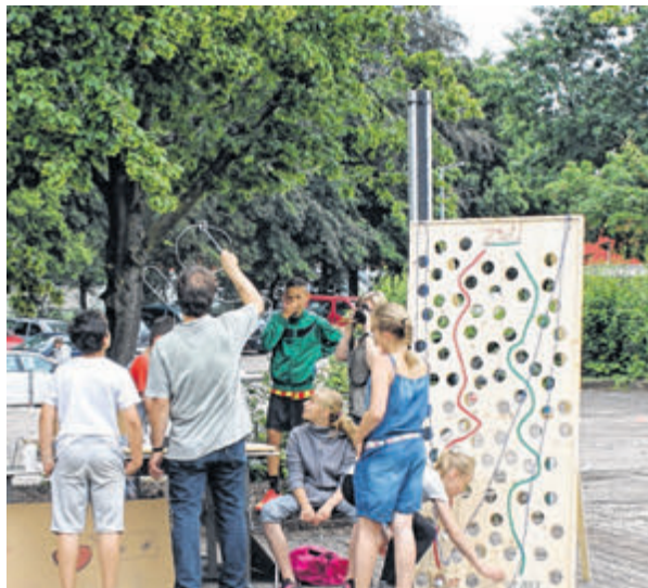
Hier wurde die Geschicklichkeit unter Beweis gestellt.