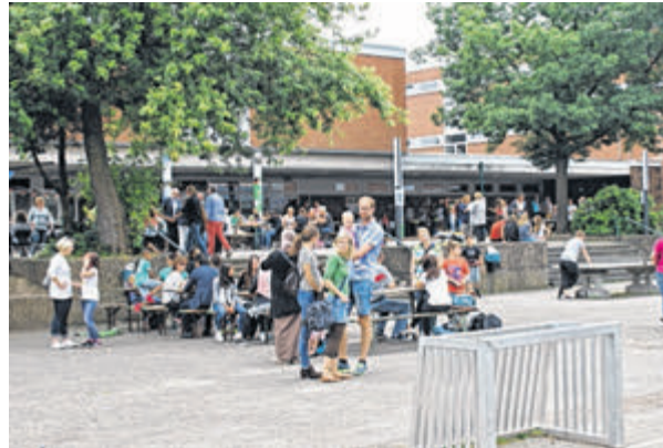
Ein buntes und fröhliches Treiben herrschte beim Sommerfest der GAL.