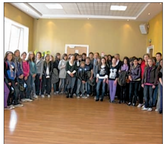
Schüler der Realschule Linnich verbrachten interessante Tage in Lesquin.