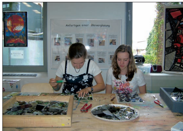
Im Glasmalereimuseum lernten die Mädchen das Material Glas kennen.