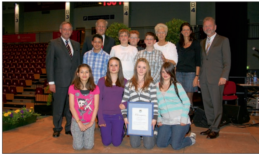
Eine Gruppe Linnicher Hauptschüler wurde für ihr soziales Engagement geehrt.