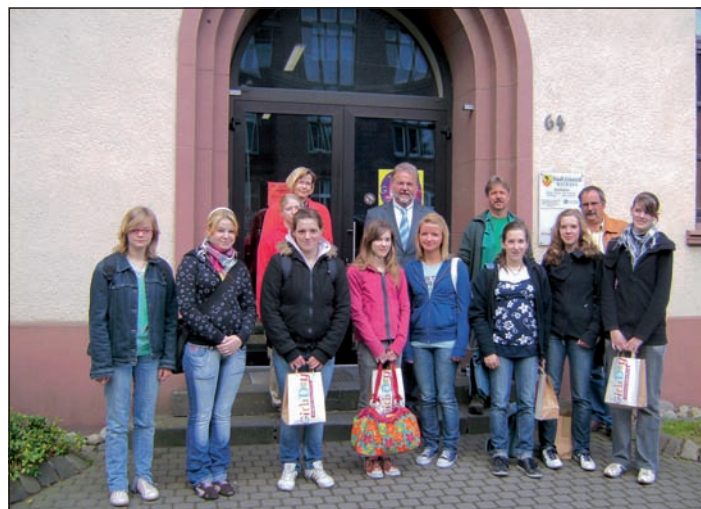
Auch die Stadt Linnich beteiligte sich mit diversen Workshops am Girls' Day.