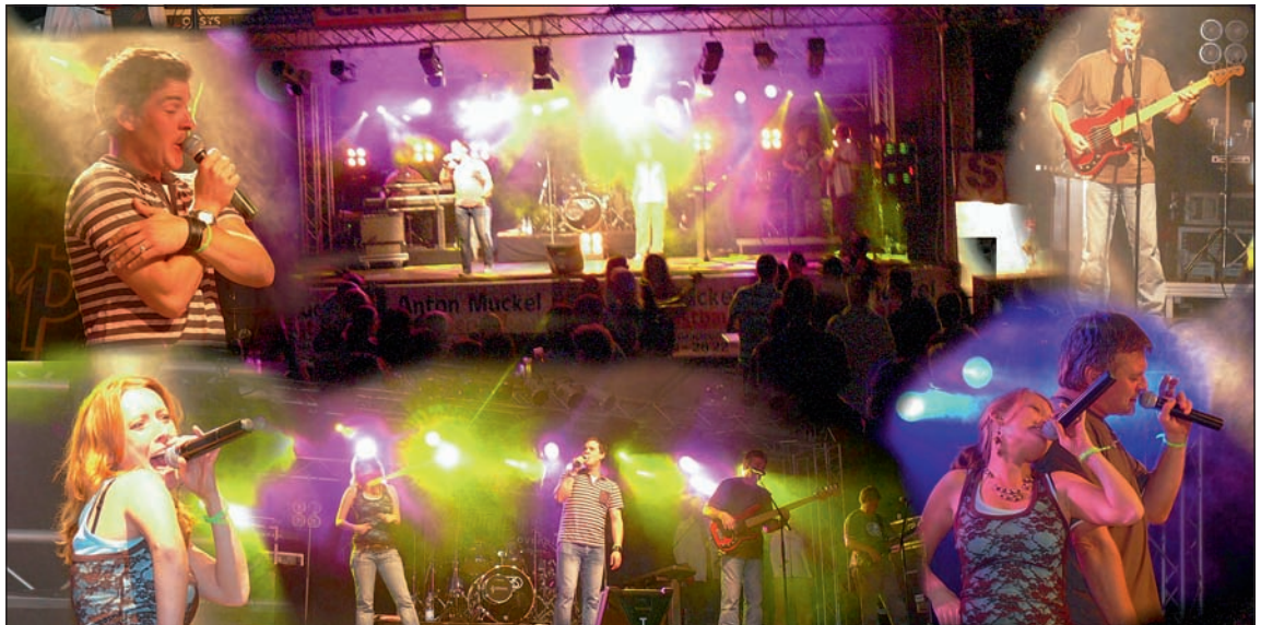
Die Coverband „For Example“ tritt wieder auf dem diesjährigen Linnicher Open Air auf.