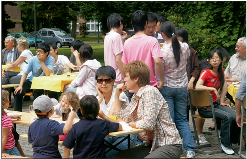
Das Freshman Institute bietet den interessierten Besuchern beim „Tag der Begegnung“ ein interessantes Programm.