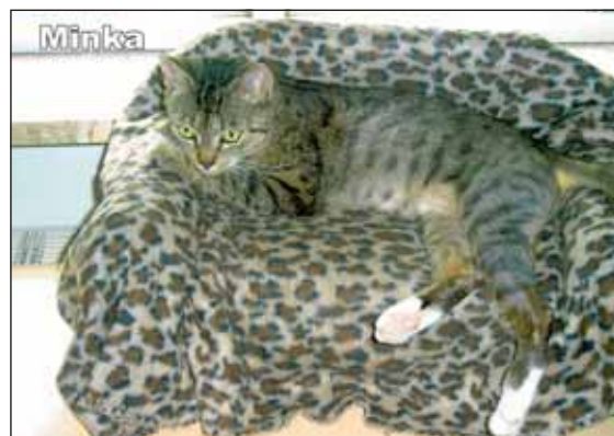
Minka sucht ein neues Zuhause.

Wir suchen für Minka ein Zuhause, indem es bereits Katzen (bevorzugt Kater) gibt und in dem sie nach