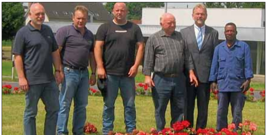
Der Kreisverkehr am Gansbruch bietet nach der Bepflanzung ein erfreuliches Erscheinungsbild.