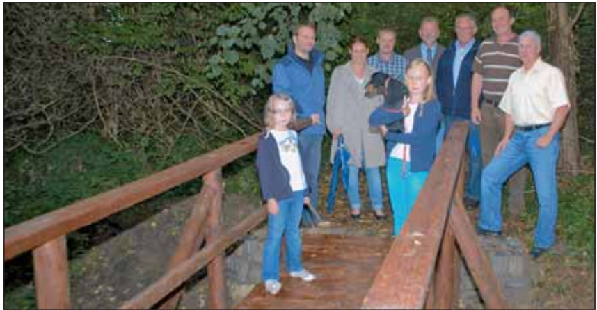
Der Weg durch das Brüchelchen ist nun wieder begehbar.