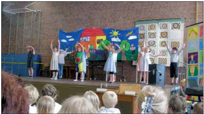
Die Schüler der KGS Linnich zauberten zum Schuljahresende ein tolles Programm auf die Bühne.

schließt sich die alljährliche Fete für alle Junggebliebenen an. Der Sonntagmorgen startet um 11.00 mit der Fortsetzung der Spiele um die Dorfmeisterschaft und einem Frühschoppen. Die Siegerehrung ist für 17.00 Uhr vorgesehen. An allen Tagen ist für kühle Getränke, Grillspezialitäten und Reibekuchen (außer Freitag) gesorgt. Die beliebte Cafeteria wird am Sonntagnachmittag ab 14.00 Uhr angeboten.