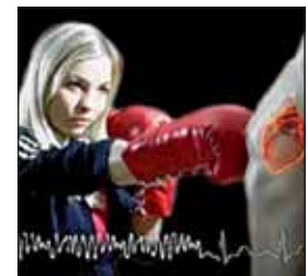
Automatisierte externe Defibrillatoren können Leben retten.

Senioren, junge Eltern und Kinder an. „Ob in unseren eigenen Ausbildungsräumen oder direkt vor Ort, wo die Leute das Wissen benötigen“, so Norbert Engels. „Wir stellen uns entsprechend auf die Notwendigkeiten und Wünsche ein.“ Für viele Betriebe und Sportvereine werden die Kosten übrigens von der Berufsgenossenschaft übernommen. Und es lohnt sich. Moderne Medien sowie eine entsprechende medizinische und pädagogische Qualifikation der Malteser Ausbilder garantieren, dass man im tatsächlichen Notfall schnell und sicher helfen kann. Unter www.malteser-kurse.de