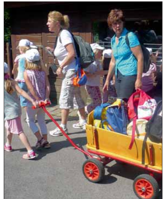
Mit hoch beladenem Bollerwagen zogen die Kinder und ihre Betreuer durch den Euregiozoo.

Zum Ausklang des schönen Tages bekamen alle in leckeres und erfrischendes Eis, bevor wir erschöpft die Heimreise antraten.